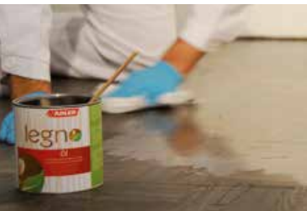
VORGANG MIT LEGNO-ÖL ODER -HARTWACHSÖL WIEDERHOLEN